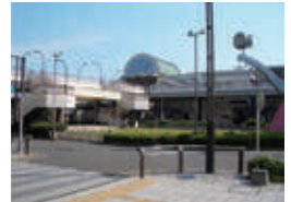
▲区画整理後の小作駅（現在）