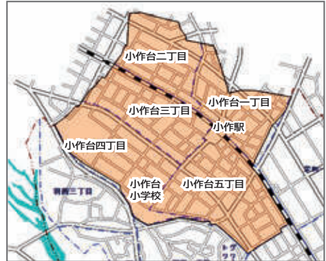
▲羽村小作台土地区画整理事業の概要図