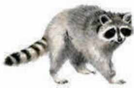
▲アライグマ