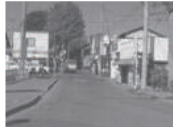
▲区画整理前の小作駅前