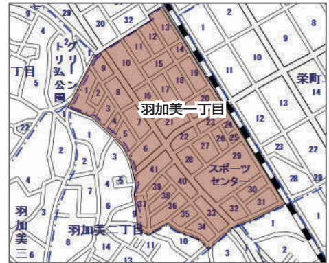
▲羽村羽ヶ上土地区画整理事業の概要図