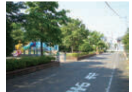
▲区画整理後の羽加美一丁目（現在）