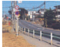
▲区画整理前の羽ヶ上地区