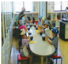
▲去年は子どもたちだけでデザートを作りました♪

筋肉づくりにまつわる食事や運動のおはなし、クイズや調理実習（親子で一緒に！わくわくハンバーグ）を行います。