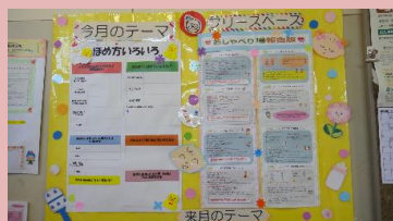
おしゃべり場（掲示板）の様子