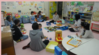
H31年度 おしゃべり場の様子

感染症の影響で令和2年度から令和4年度は掲示板で実施していましたが、令和5年度からは皆さんが輪になって楽しくお話ができるおしゃべり場を再開します！初回は5月に実施予定です。詳細は広報はむら5月1日号や公式サイト等をご覧ください。