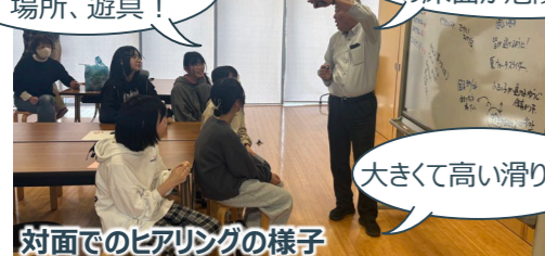
対面でのヒアリングの様子